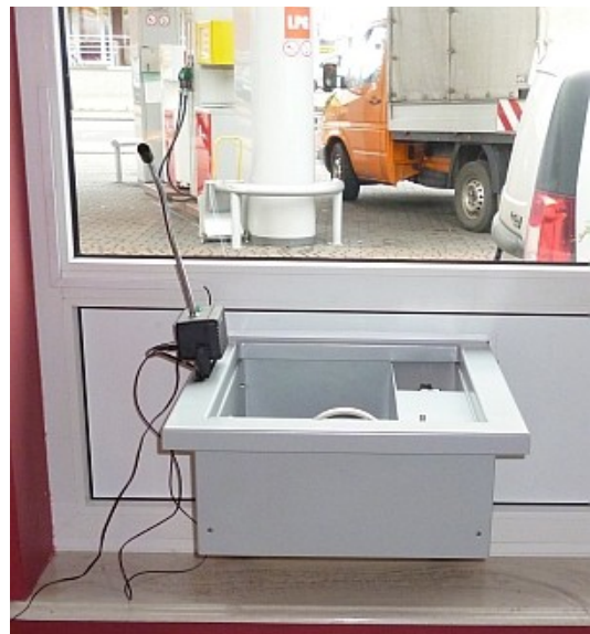
Widok zamontowanego podajnika od wewnątrz