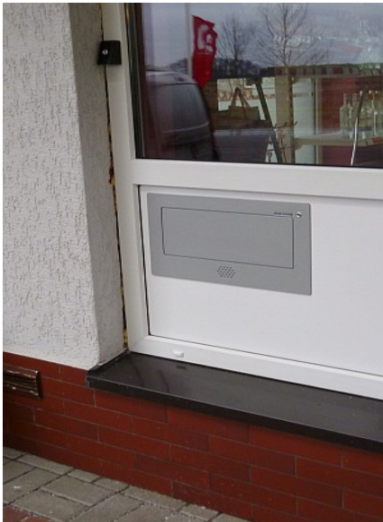
Podajnik IB-ps3 – widok od zewnątrz