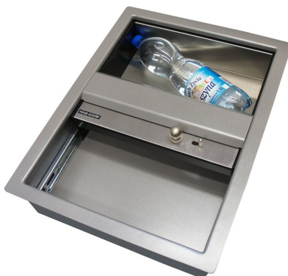
Podajnik IB-pk6/A4 swobodnie mieści średniej wielkości towary