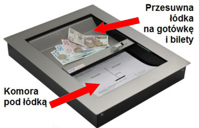
IB-pk4, IB-pk3, IB-pk5,