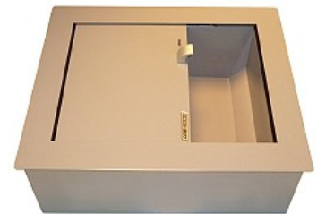
Podajnik głęboki IB-pk3m