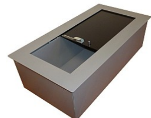
Podajnik długi i głęboki IB-ptp

Przesuwana pokrywa podajnika - sterowana od strony kasjera spełnia następujące zadania: