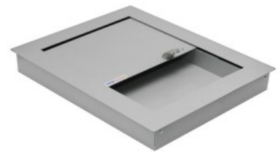
Podajnik płytki IB-pk2m – stal lakierowana