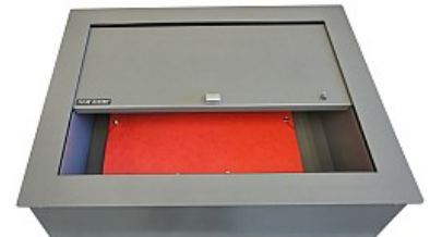
Podajnik poprzeczny, głęboki na TECZKI A4 - IB-pk8m