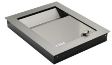
Podajnik płytki IB-pk2c – wykończenie: stal nierdzewna

PODAJNIKI KASOWE Z PRZESUWNĄ POKRYWĄ STANOWIĄ NIEZBĘDNE WYPOSAŻENIE STANOWISK PODAWCZYCH, GDZIE DOCHODZI DO WYMIANY GŁÓWNI DOKUMENTÓW, PAKIETÓW, oraz PIENIĘDZY.