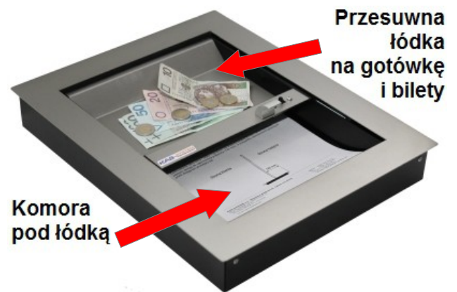
IB-pk4, IB-pk3, IB-pk5,