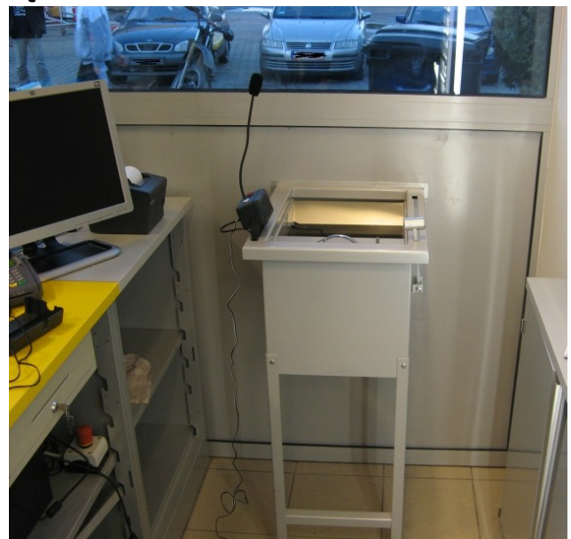
Podajnik wolno stojący z wykorzystaniem dostarczanej w kpl. podpory