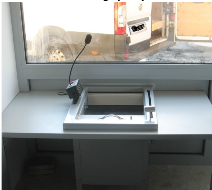
Podajnik wbudowany w blat wewnętrzny

Widoki zamontowanego podajnika OD WEWNĄTRZ