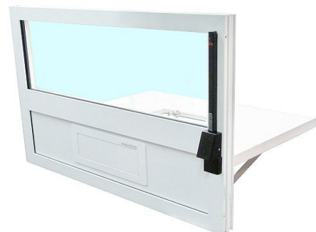
Moduł MZ4 przymocowany do profilu nad podajnikiem szufladowym.