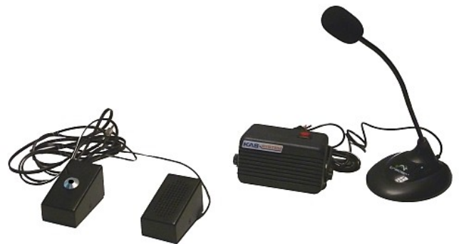
Baza IB-IKG-D1 + moduł MZ2