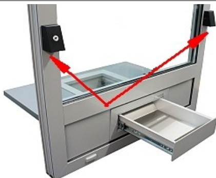
Moduł MZ2 przymocowany do profilu witryny – nad podajnikiem szufladowym.