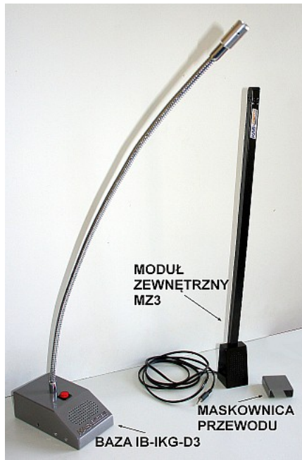
Baza IB-IKG-D3 + moduł MZ3