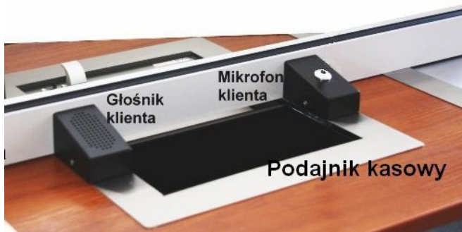
Moduł MZ2 zintegrowany z podajnikiem kasowym